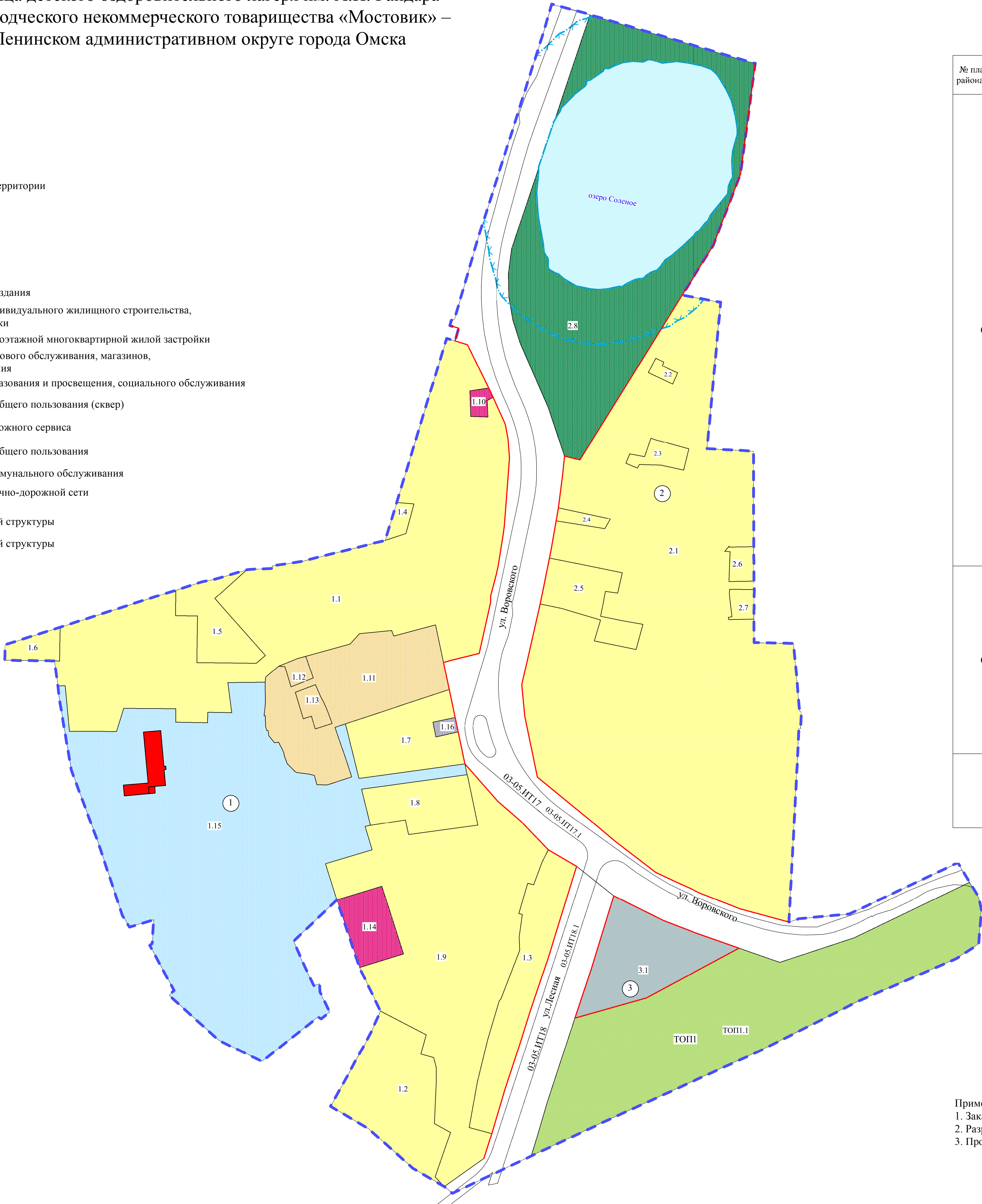
Экспликация зон элементов планировочной структуры №1-3, 03-05.ИТ17, 03-05.ИТ18, ТОП1